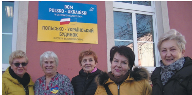
Seniorki OUTW przed Domem Polsko-Ukraińskim.