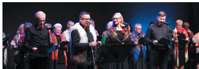
Zespół Seniorita – elegancja, muzykalność, talent.

W czerwcu br. podczas dorocznej akcji pn. „Słyszcie dobre dźwięki” zostaną opublikowane wyniki wspomnianych badań. W czasie tej akcji przeprowadzone zostanie badanie słuchu seniorów, odbędą koncerty muzyczne